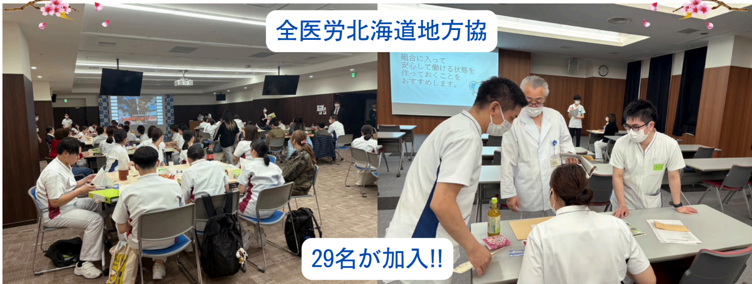
全医労北海道地方協