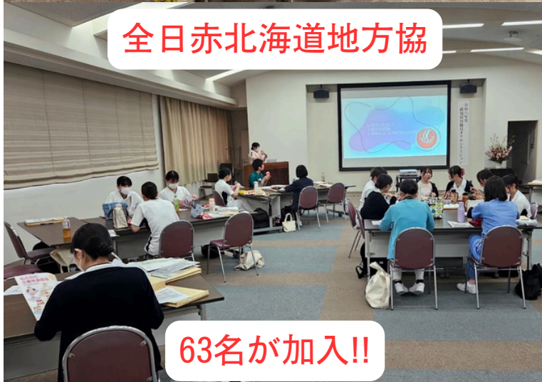
全日赤北海道地方協